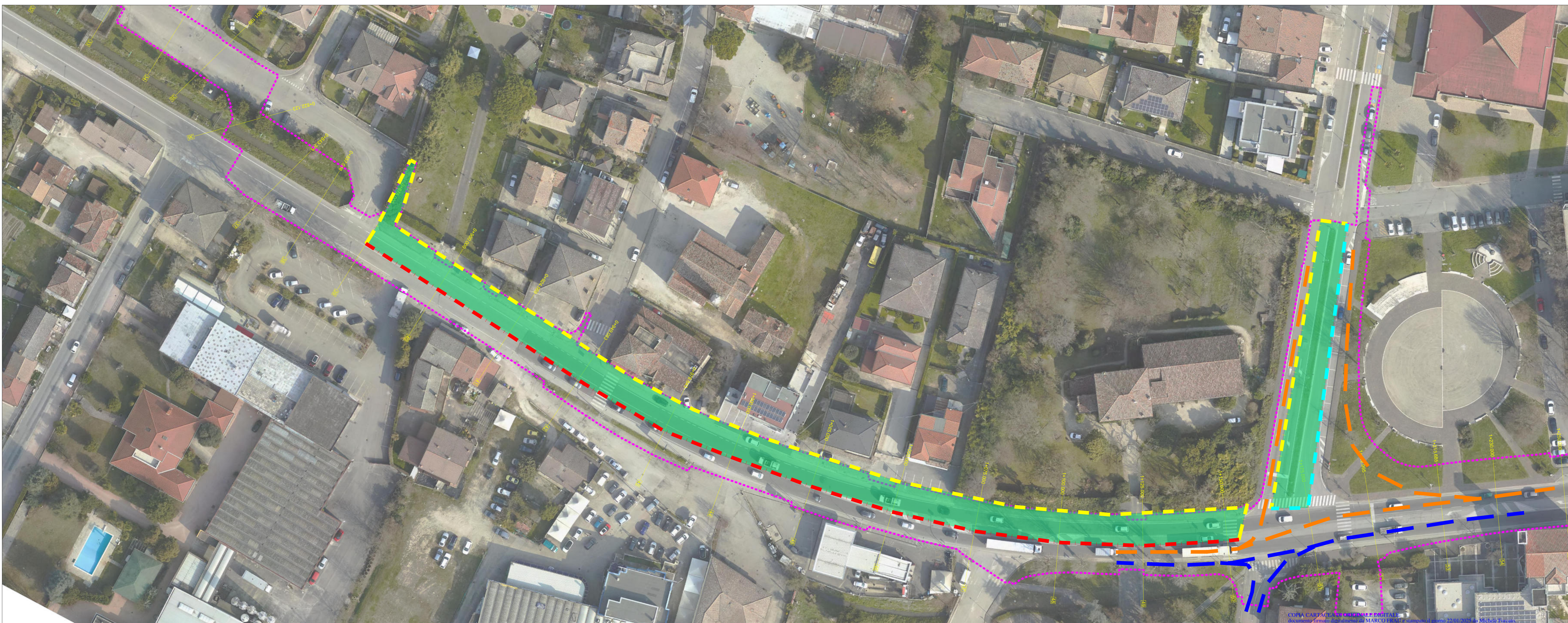
Wbe 001 - Fase 3.1